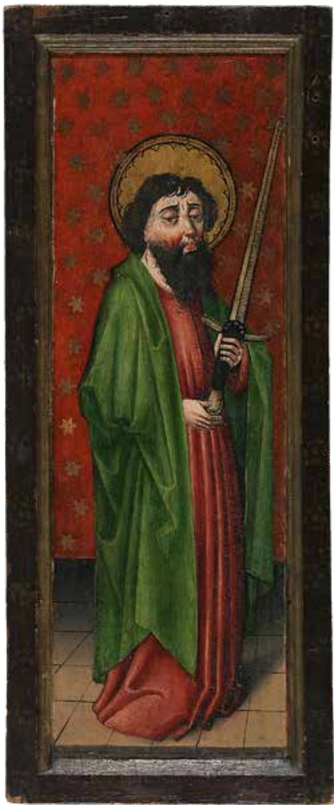
Werkstatt Michael Wolgemut: Hl. Paulus 1483