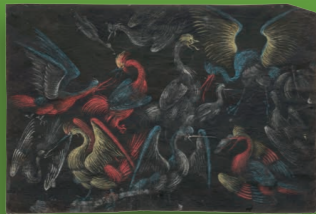
Oben links: Heil-Epiphani, GNM; oben rechts: Hans Plöcknerwurf II, Streitende Wägel, UB Erlangen; unten: Schwabacher Hochaltar (Detail), Titelfolgie: Albrecht Dürer, Bildnis Michael Wolgemut, GNM