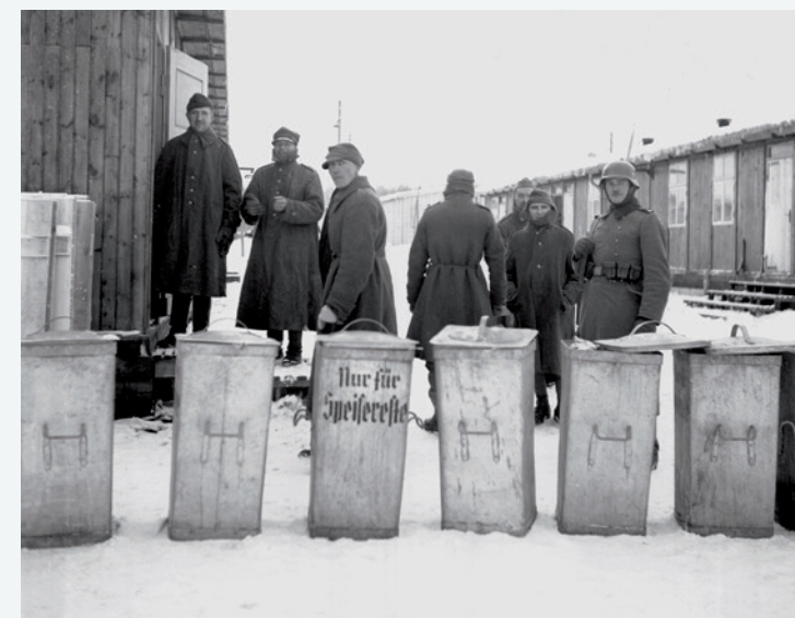
Vor der Lagerkantine (Stadtarchiv Erlangen) Przed kantiną obozową (Stadtarchiv Erlangen)

Na doroczne zjazdy NSDAP do Norymbergii zjeżdżali setki tysięcy członków i sympatyków partii. Spektakularne obrazy z tych masowych imprez obiegły świat i do dziś wpływają na pamięć o czasach narodowego socjalizmu. Nie jest natomiast faktem powszechnie znanym, że podczas II wojny światowej na terenie zjazdów powstał rozległy kompleks obozowy.