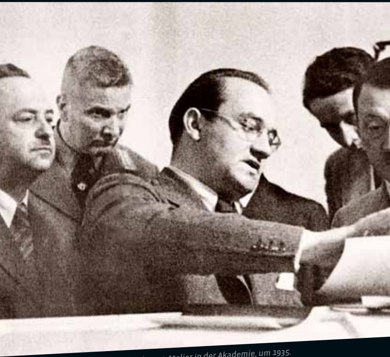
Adolf Hitler und Franz Ruff in dessen Atelier in der Akademie, um 1935.

Im Jahr 2012 begeht die Akademie der Bildenden Künste Nürnberg ihr 350-jähriges Bestehen. In zahlreichen Veranstaltungen werden Geschichte und Gegenwart der ältesten Kunsthochschule Deutschlands thematisiert. Die Ausstellung „Geartete Kunst“ im Dokumentationszentrum Reichsparteitagsgelände setzt sich mit der Geschichte der Institution im „Dritten Reich“ auseinander. Im Fokus der Präsentation stehen unter anderem die Hintergründe, die bei der Erhebung der Staatsschule zur Akademie auf ausdrücklichen Wunsch Adolf Hitlers eine Rolle gespielt haben, sowie die Verflechtungen zwischen Akademie, Lehrpersonal und Partei. Besonderes Augenmerk gilt dabei dem Direktor der Akademie, Professor Hermann Gradl, der als „Maler des Führers“ zu den „begnadeten Künstlern“ des Reiches zählte.