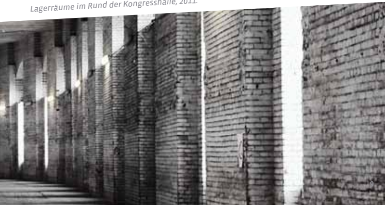
Lagerräume im Rund der Kongresshalle, 2011.

Beide Veranstaltungen sind eine Kooperation mit dem Bildungszentrum im Bildungscampus der Stadt Nürnberg.