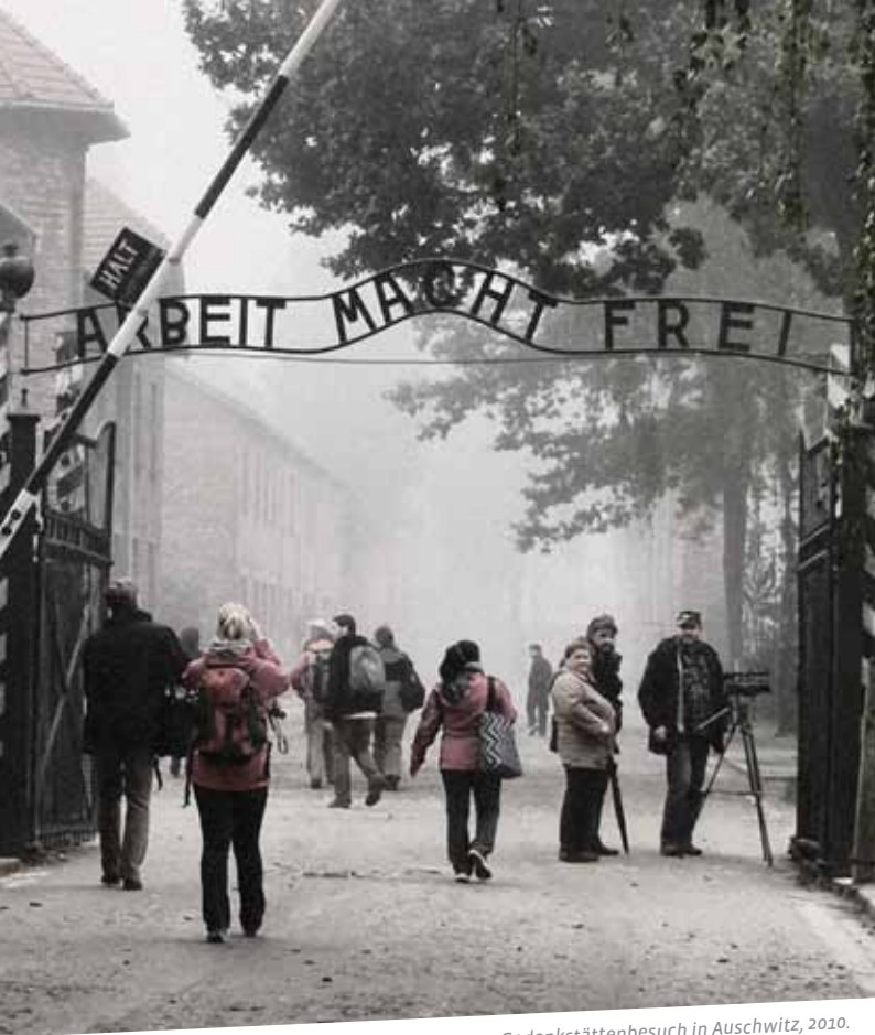
Gedenkstättenbesuch in Auschwitz, 2010.